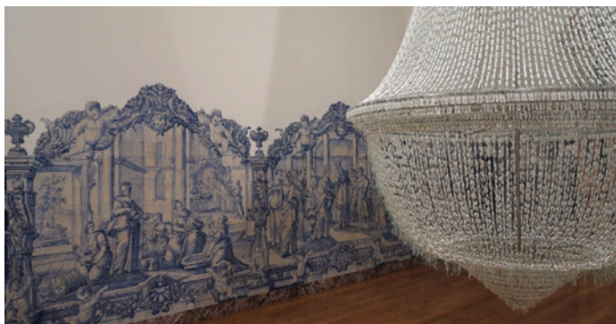
MACE – Museu de Arte Contemporânea de Elvas

visitantes e turistas, sem deixar de acautelar a integridade dos bens patrimoniais e os benefícios para as comunidades locais.