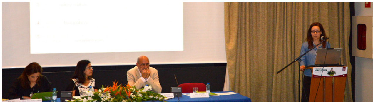
Seminário “Estratégias de Internacionalização da Fileira Agroalimentar”, realizado a 11 de junho de 2015 na Feira Agrícola de Santarém, onde foram apresentados o balanço e os resultados preliminares da avaliação externa realizada pela Quaternaire Portugal ao projeto “Sabores de Portugal”

O projeto “Sabores de Portugal”, cofinanciado pelo COMPETE – Programa Operacional Fatores de Competitividade do QREN – Quadro de Referência Estratégica Nacional e enquadrado nos Sistemas de Incentivos aos Investimentos das Empresas, em concreto no SI Qualificação PME – Sistema de Incentivos à Qualificação e Internacionalização de PME, foi a primeira experiência da Confederação dos Agricultores de Portugal no desenvolvimento de projetos conjuntos de participação de PME da fileira agroalimentar em exposições internacionais com vista ao apoio à sua internacionalização.