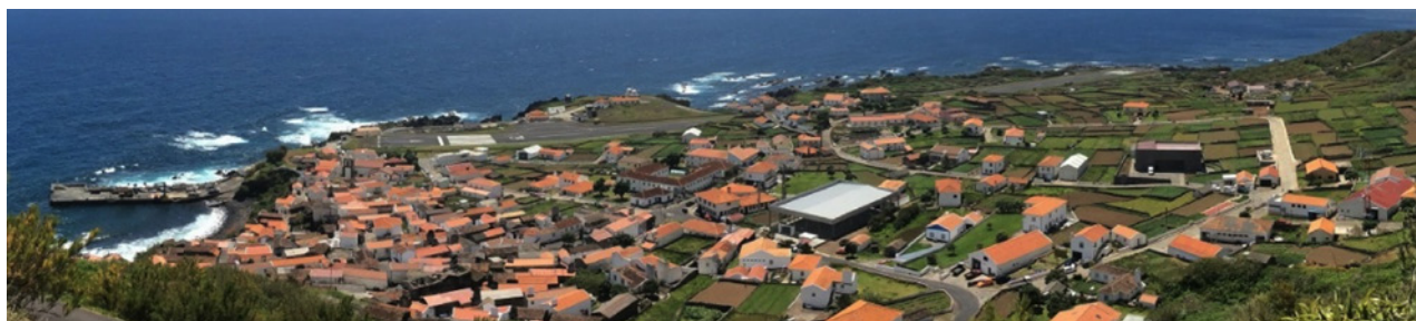
Vista panorâmica da ilha do Corvo

A Quaternaire Portugal colaborará com o Município da Lourinhã na ponderação do processo de discussão pública e na produção da versão final do Plano que se perspetiva ser aprovada em Assembleia Municipal até o final do presente ano. O PDM da Lourinhã é um dos primeiros PDM a ser revisto à luz do Plano Regional de Ordenamento do Território do Oeste e Vale do Tejo e, simultaneamente, à luz na nova Lei de Bases da Política de Solos, Ordenamento do Território e Urbanismo.