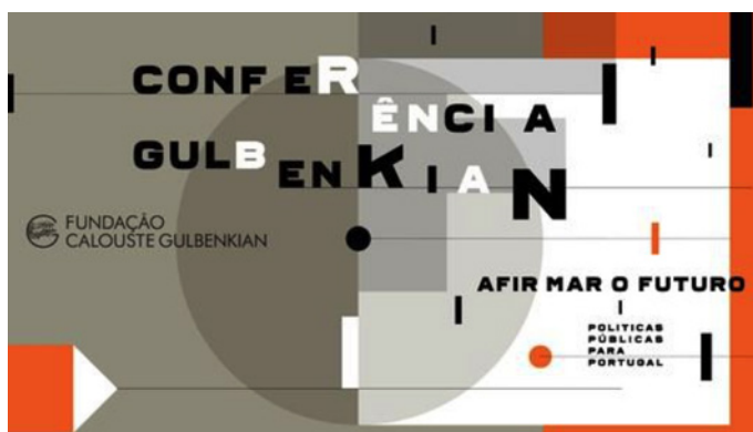
Imagem gráfica da Conferência e Publicação Afirmar o futuro: políticas públicas para Portugal

Foram recentemente publicadas, em dois volumes, as Atas da Conferência Afirmar o futuro: políticas públicas para Portugal , que decorreu na sede da Fundação Calouste Gulbenkian, em Lisboa, entre 6 e 7 de Outubro de 2014. Comissariada por Viriato Soromenho-Marques, e organizada pela Fundação Calouste Gulbenkian em parceria com o Institute of Public Policy Thomas Jefferson-Correia da Serra, esta conferência pretendeu suscitar uma reflexão crítica acerca do contexto atual e dos desafios que este coloca às políticas públicas, num momento de crise que o país e a Europa atravessam. Reunindo um amplo painel de especialistas (economistas, geógrafos, sociólogos, entre outros), oriundos na sua maioria do meio académico nacional, esta publicação reúne um conjunto de artigos que abordam um leque diversificado de temas relacionados com a formulação de políticas públicas na atualidade. Entre estes artigos, que consolidam as comunicações orais apresentadas publicamente, salientamos os contributos dos três Administradores Executivos da Quatenaire Portugal .