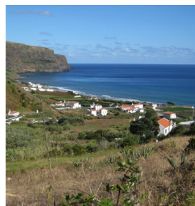
Praia Formosa (Ilha de Santa Maria)

Os Planos de Pormenor das Zonas Balneares dos Anjos e Praia Formosa, em Vila do Porto (Santa Maria, Açores) foram aprovados pela Assembleia Municipal, tendo sido publicados no passado dia 19 de outubro no Jornal Oficial da Região Autónoma dos Açores, ao fim de 4 anos de sessões de trabalho e discussão e elevada participação pública.