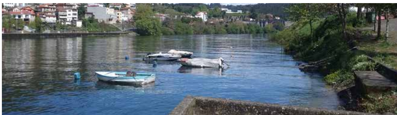
Ocupação urbana nas margens da albufeira

O Programa Especial da Albufeira de Crestuma-Lever (PEACL) iniciou-se em 2019 e a sua elaboração ocorre mais de uma década após a entrada em vigor do Plano de Ordenamento da mesma albufeira, igualmente desenvolvido pela Quaternaire Portugal . Trata-se, por um lado, que reconduzir um plano especial a programa especial, dando resposta à alteração do quadro legal operada em 2014/2015. O PEACL visa, ainda, a atualização das soluções adotadas no plano em face das novas dinâmicas socioeconómicas verificadas no território.