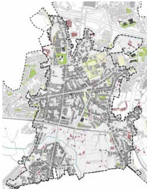
Delimitação da área de estudo

A cidade de São Mamede de Infesta assume-se, agora, como a prioridade para estender a dinâmica reabilitação a outros setores urbanos do concelho, fruto das diversas problemáticas que encerra, das dinâmicas que se começam a sentir e das oportunidades que a envolvente lhe proporciona, estando prevista a sua conclusão até ao final do presente ano.