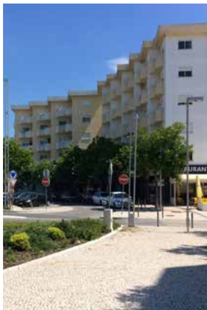
Paisagem urbana de Fátima

A Quaternaire Portugal iniciou em 2019 a segunda revisão do Plano de Urbanização de Fátima, um plano que orienta, desde 1995, o desenvolvimento de Fátima, cidade-santuário com elevado significado religioso e simbólico para o mundo católico.