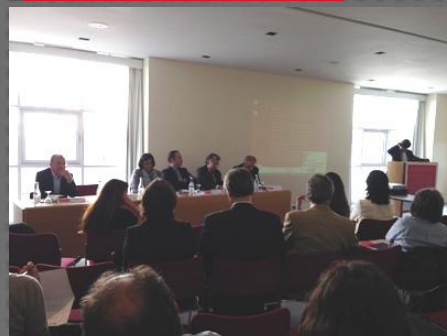
Seminário: Estratégias de formação-ação em Portugal | PME, Lisboa, CCB, 3 de outubro de 2013